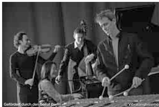
Gefördert durch den Senat Berlin